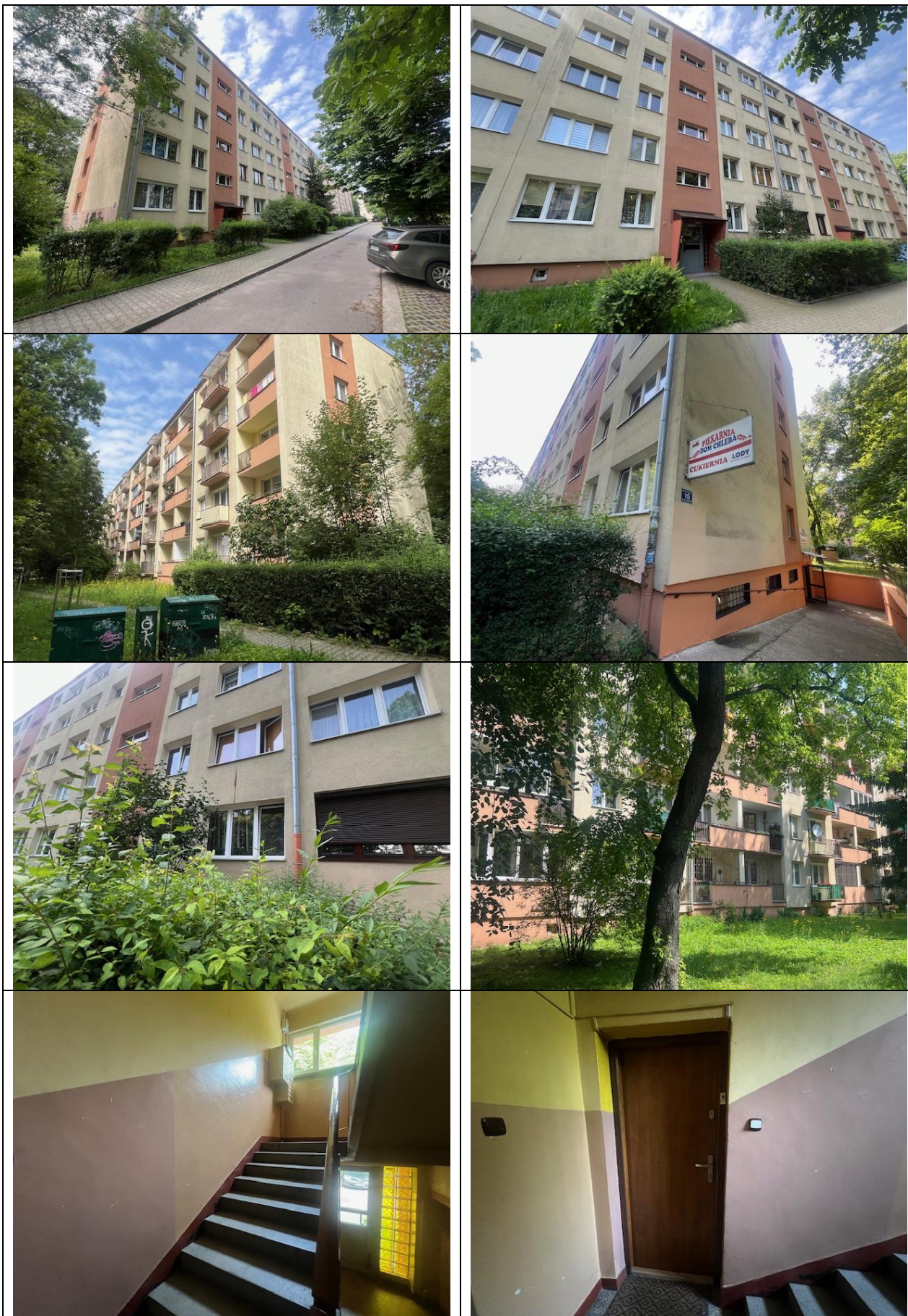
ogólny widok budynku i wnętrze