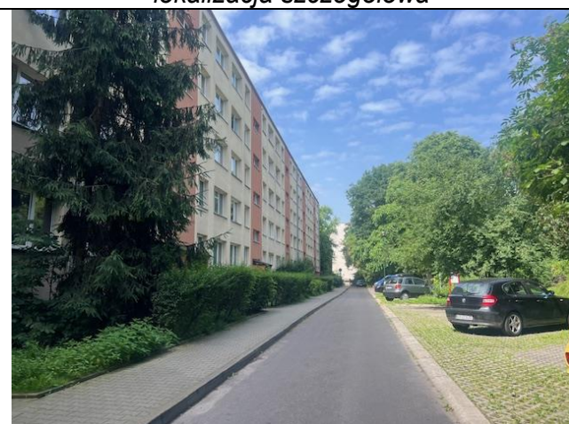
otoczenie nieruchomości i dojazd

Przedmiotowa nieruchomość lokalowa położona jest w budynku wielolokalowym o funkcji mieszkalnej przy ul. płk. Francesco Nullo w Krakowie. Ulica Płk. Francesco Nullo położona jest na wschód od ścisłego centrum miasta, na terenie jednostki ewidencyjnej Śródmieście. Odległość od Rynku Głównego wynosi około 2,5 km. Dostęp do komunikacji miejskiej – bardzo dobry.