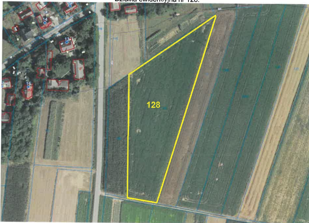
Działka ewidencyjna nr 128:

Działka ewidencyjna nr 128 o powierzchni 0,8500 ha niezabudowana, uprawiana rolniczo, posiada rodzaj użytku jako grunty orne klasy RI, położona w obszarze o płaskim ukształtowaniu terenu. Działka posiada kształt wieloboku zbliżonego do różnobocznego trapezu. Urządzenia infrastruktury technicznej w sąsiedztwie. Działka od strony południowej posiada bezpośredni dostęp do wewnętrznej, polnej drogi, stanowiącej działkę nr 313 będącą własnością Gminy Bolesław.