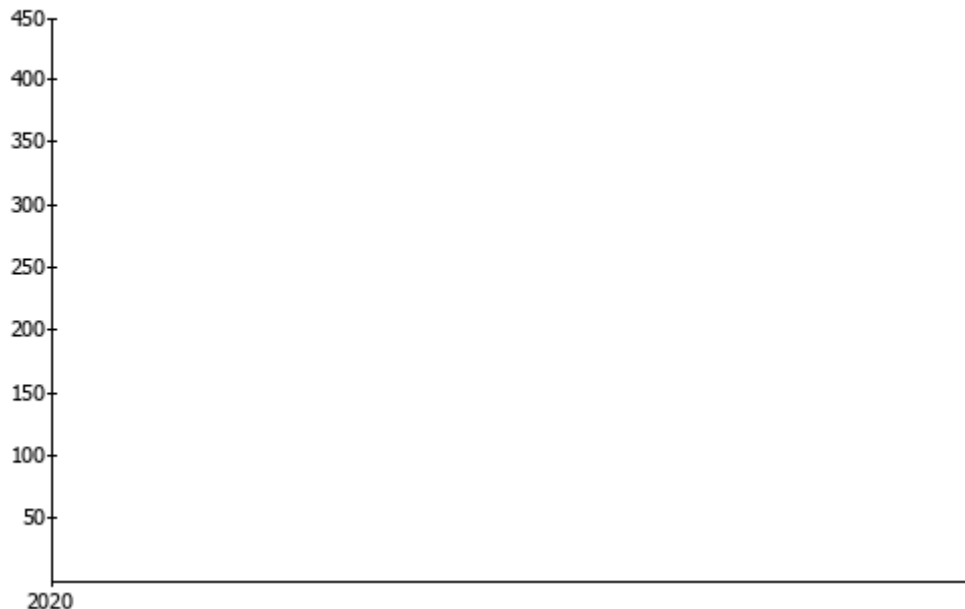
Cykl konwersji gotówkowej

Algorytmy, które stosowane są w analizie płynności mają następującą postać: