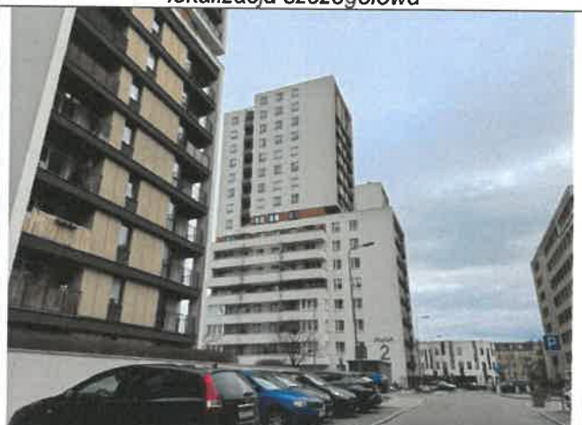
otoczenie nieruchomości i dojazd

Przedmiotowe miejsce postojowe nr 28 i schowek nr 12 usytuowane są w budynku wielolokalowym na os. Avia 2 w Krakowie. Osiedle Avia położone jest w północno - wschodniej części miasta, na terenie jednostki ewidencyjnej Nowa Huta. Odległość od ścisłego centrum miasta wynosi około 6 km. Dostęp do komunikacji miejskiej dobry. W bliskiej odległości od nieruchomości znajdują się: stacja benzynowa, sklepy, poczta, apteka, przychodnia lekarska, punkty oświaty.