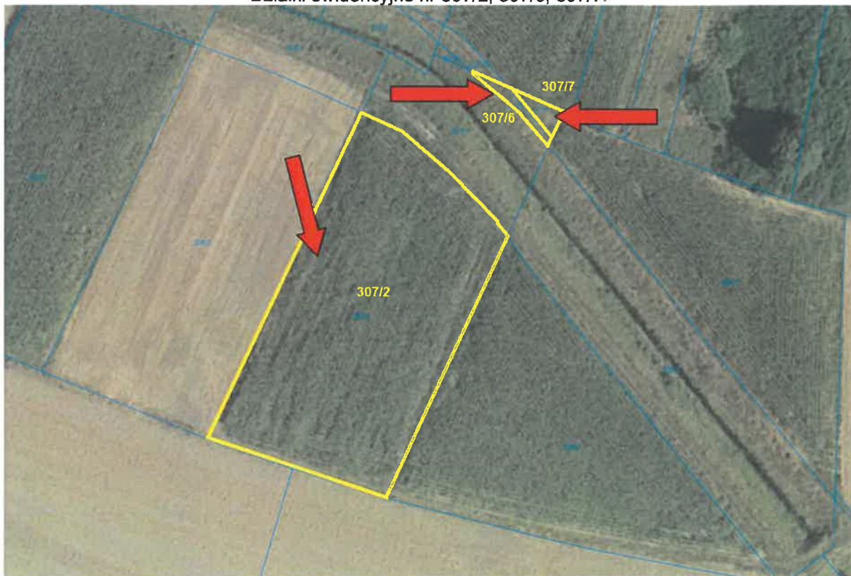
Działki ewidencyjne nr 307/2, 307/6, 307/7:

Działka ewidencyjna nr 307/7 o powierzchni 0,0029 ha niezabudowana, posiada rodzaj użytku jako grunty orne klasy RIVa, położona w obszarze o płaskim ukształtowaniu terenu. Działka posiada kształt wieloboku zbliżonego do prostokątnego trójkąta. Od strony południowej graniczy z rowem. Urządzenia infrastruktury technicznej w dalszej odległości. Działka nie posiada prawnie uregulowanego dostępu do drogi publicznej. Ze względu na swoje parametry takie jak powierzchnia, szerokość ma ograniczone możliwości użytkowania.